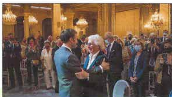
PRÉSIDENT DE LA RÉPUBLIQUE