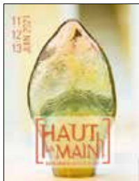
Une vitrine de la création contemporaine.

Les derniers travaux d'une quarantaine de professionnels des métiers d'art (sculptures, bijoux, arts de la table, luminaire, mobilier, vêtements et accessoires) seront présentés dans un lieu unique en plein air. L'atmosphère de la Halle Gruber, qui correspond parfaitement à la philosophie des créateurs - simplicité, ouverture et